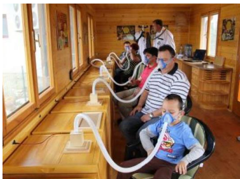
Respiračná apiterapia – človek vdychuje klímu, ktorú vytvárajú včely v úli