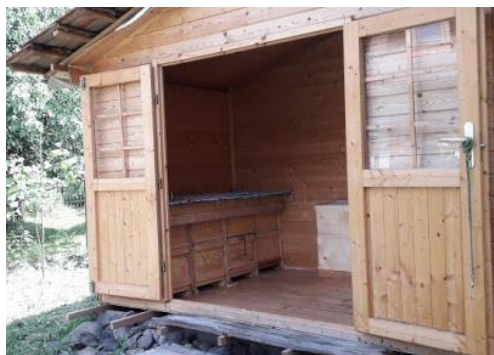
Apiterapia – pobyt v domčeku so včelími úľmi, (zdroj obrázka: http://svetvčely.vlastnyweb.sk/apiterapia/ )

chronických zápalov a ďalších chorôb. Iným spôsobom apiterapie je aj samotné aplikovanie včelieho jedu v malých dávkach . Včelí jed spôsobuje otravu až vo veľkých dávkach (niekoľko stoviek bodnutí včelou), výnimkou sú jedinci alergickí na včelí jed (1-3% populácie). Včelí jed rozširuje drobné cievy okolo dôležitých orgánov ako srdce, mozog, dýchací aparát, stimuluje krvný obeh a metabolizmus organizmu, lieči sa ním aj artritída či reumatizmus.